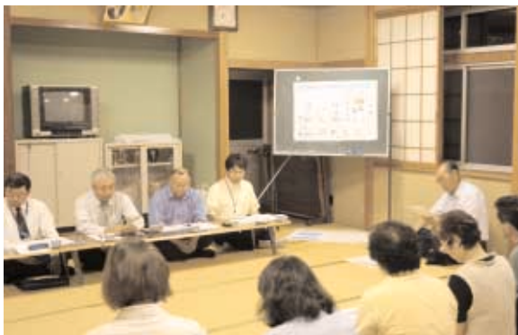
滝谷新田集落説明会

現在、各集落において情報化事業の説明会を開催しております。既に半数の集落を終了し、参加された皆様からも様々なご質問・ご意見をいただいております。